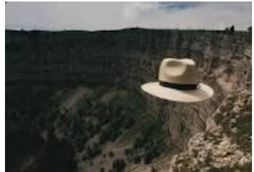
Le retour du chapeau

Woensdag 18 januari 13.30 uur Vrijdag 20 januari 11.00 uur